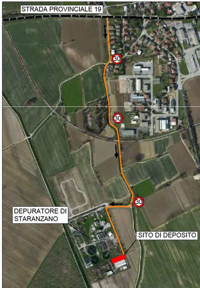
1. Mappa di percorso per deposito tubazioni

Durante la fase di trasporto, in particolare lungo il percorso individuato nella mappa sottostante, bisognerà porre attenzione a non superare la velocità di 30 km orari in modo tale da effettuare l'operazione in sicurezza. Oltre a tali operazioni l'Affidataria dovrà predisporre una recinzione e relativa segnaletica assicurando la messa in sicurezza del luogo di deposito.